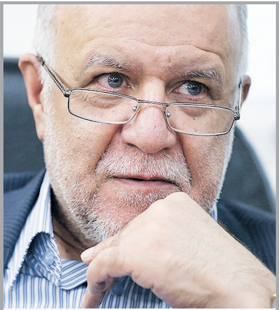
زنگنه از قراردادهای یک شبه برای ۳۰ دکل نفتی و خریدهای میلیاردی پرده برداشت: